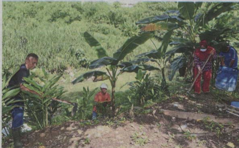
Residents of Pangsapuri Mutiara Magna in Kepong have been actively involved in monitoring Sungai Keroh since the middle of last year.

Residents transform riverbanks into edible gardens by planting fruits and vegetables