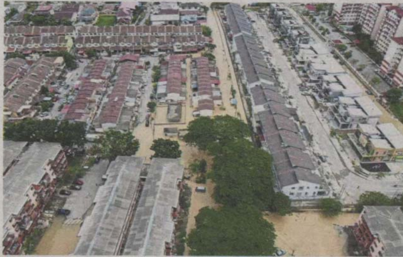
(Left) About 200 houses were affected by the floods on July 31.

About 100 affected families evacuated to four relief centres in Dengkil