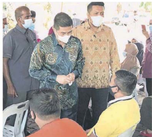
阿兹敏阿里与出席民众寒暄问好。

出席者包括房政部长祖莱达、高等教育部副部长拿督曼梳、诗布朗再也区州议员阿菲夫和鲁乃区州议员阿兹曼。